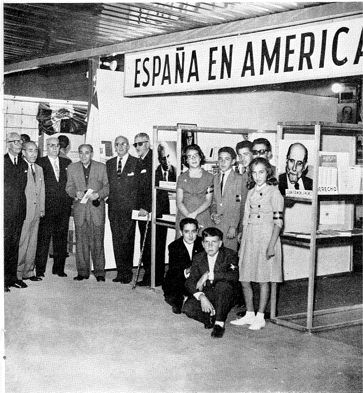
El Pabellón ESPAÑA EN AMÉRICA fue diseñado por Pablo Gago