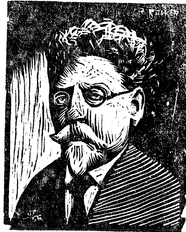
N, en Alemania 1873, H, en 1958.

(9) J. B. Say, economista inglés de la época, cuyas Obras Completas fueron traducidas al alemán por Max Stirner. La fobia de Carlos Marx por el pensamiento anarquista francés (como es sabido, su MISERIA DE LA FILOSOFIA, es una continua crítica de la obra de Proudhon, FILOSOFIA DE LA MISERIA) y por el libre pensamiento alemán (su voluminoso libro DOCUMENTOS DEL SOCIALISMO es un vano e irrisorio intento por empujear y restar importancia al UNICO Y SU PROPIEDAD de Stirner) se evidenciaba también contra este sociólogo británico, muy comentado en aquel entonces por cuantos criticaban y trataban de evadirse de la tiranía del Estado. — (Nota de los editores)