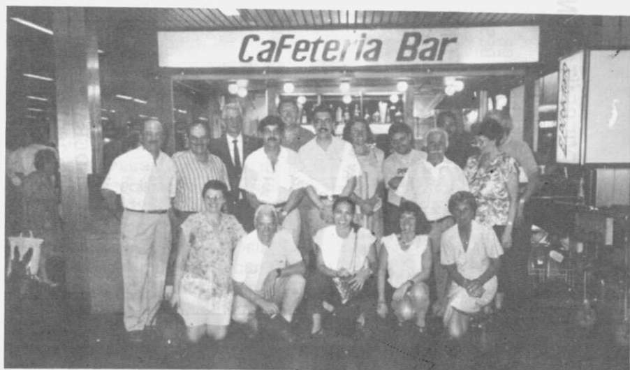
Recepción de la delegación coruñesa en el aeropuerto internacional de Ezeiza.