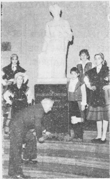
El presidente, Enrique Soñora rinde un simbólico homenaje a Rosalía Castro con motivo de las fiestas de Betanzos.

"Se non cambiamos a nosas formas de vida cultural non lograremos atraer os nosos fillos e a todos aqueles que poden estar interesados nas nosas cousas. Eu quero facer todo o que sexa posible para cambiar as formas de traballo co fin de interesalos no teatro, na masa coral, na escola de danzas que debe formarse con un elevado sentido do arte, na vida musical, en cursos de idioma galego e literatura, así como na proiección de filmes documentales e de argumento que se refiran a la Galicia e a problemas galegos. Se non somos capaces de facer esto, non lograremos o propósito por todos aneado".