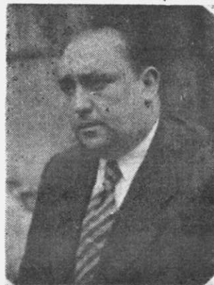
Tomás López Datorre, el último alcalde del régimen republicano y diputado provincial, que fue fusilado por los franquistas.

Aquel equipo de hombres con ideas progresistas, surgido de las