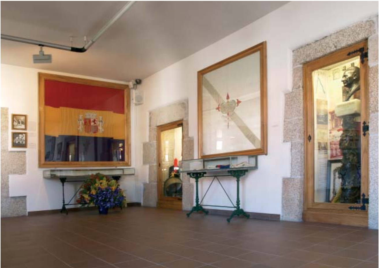
A Bandeira do Goberno Republicano Español no Exilio xunto á Bandeira das Irmandades da Fala de Betanzos e o busto de Castelao, procedente do Centro Betanzos de Buenos Aires, no Museo das Mariñas.

en Hespaña ocurrirán cousas a longo e curto plazo, e non queremos nin debemos estar desconectados cando esas cousas ocorran. Por outra parte, Gordón Ordás chegará eiquí moi pronto n' un viaxe por toda América, que eu supoño que non é de turismo. Estuvo fai pouco en Chile onde falamos moito. El está en excelente posición con referencia a Galicia. Por eso nós eiquí queremos enlazar con él, e poñel-o en contaito con núcleos políticamente máis vivos da coleitividade galega, que é, dito sexa de pasada, o máis vital que ten aquí o republicanismo peninsular. Incluso pensamos facerlle un grande homenaxe coleitivo no seu carácter de Xefe de Goberno republicano en eisilio, ao través do Consello de Galicia.