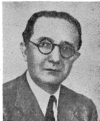
ALFONSO R. CASTELAO Presidente do Consello de Galiza O home que hoxe encarna a vontade autonomista do povo galego